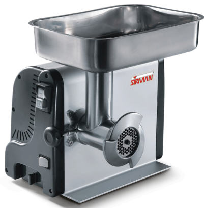
Sirman Мясорубки , model TC 8 Vegas :

Sirman Spa Viale dell'Industria 9/11 35010 PIEVE DI CURTAROLO (PD), Italy Tel./Fax. +39 049 9698666 / +39 049 9698688 email: info@sirman.com