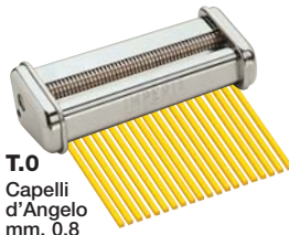
T.0 Capelli d'Angelo mm. 0,8