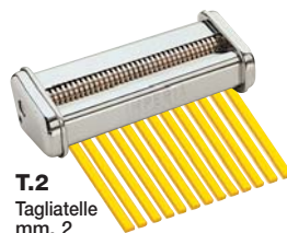
T.2 Tagliatelle mm. 2