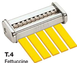
T.4 Fettuccine mm. 6,5