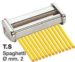
T.S Spaghetti Ø mm. 2