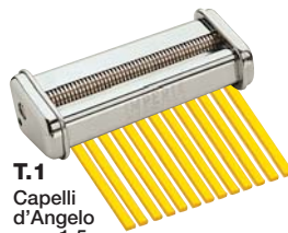
T.1 Capelli d'Angelo mm. 1,5