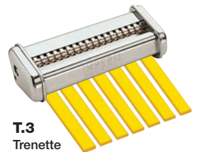
T.3 Trenette mm. 4