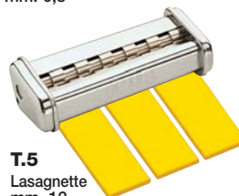
T.5 Lasagnette mm. 12