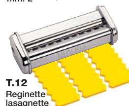
T.12 Reginette lasagnette mm. 12